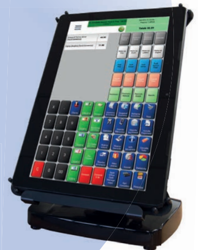
Sistema versatile da 13"