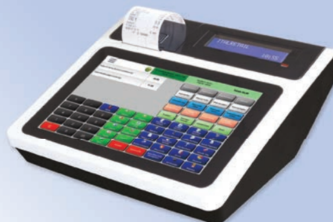
Sistema compatto all in one