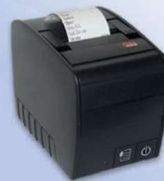
Stampante non fiscale