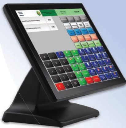
Sistema completo all in one